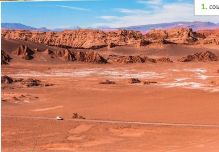
El desierto de Atacama

1. couvrant 2. chaîne de montagnes 3. abrite