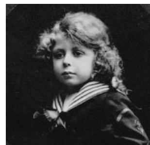
Jean-Paul Sartre, enfant (1908).

« Poulou » est élevé par sa mère et ses grands-parents (« Karlémami ») à Meudon puis à Paris à partir de 1911. Il grandit parmi les livres de la bibliothèque de son grand-père : « Corneille, c'était un gros rougeaud, rugueux, au dos de cuir, qui sentait la colle [...]. Flaubert, c'était un petit entoilé, inodore, piqueté de taches de son. Victor Hugo le multiple nichait sur tous les rayons à la fois » ( Les Mots ). Il commence à écrire et adresse même une lettre à Courteline en janvier 1912.