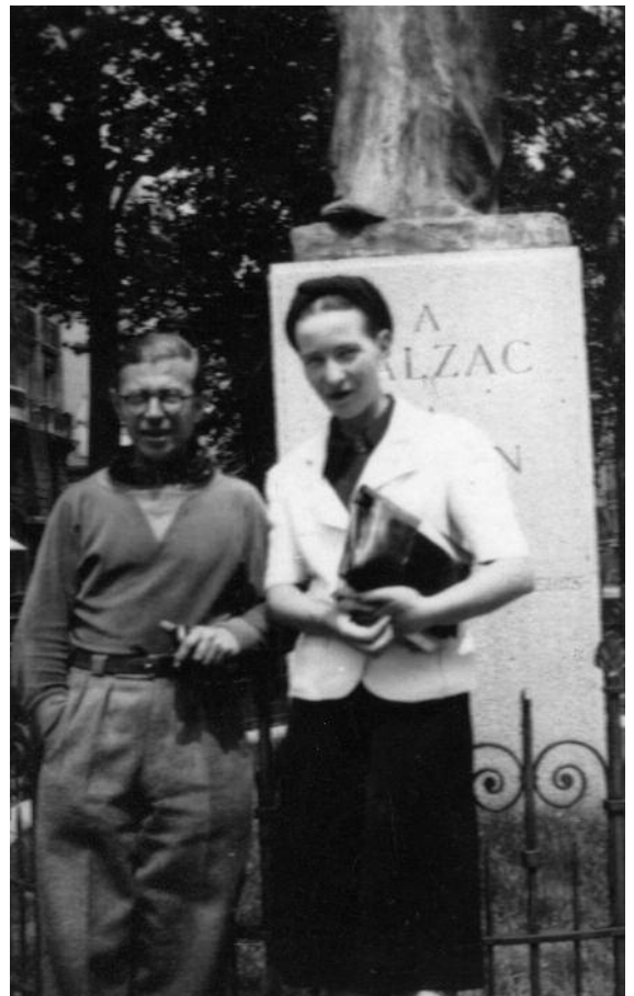
Sartre et Simone de Beauvoir boulevard Raspail, devant la statue de Balzac par Rodin, vers 1929.