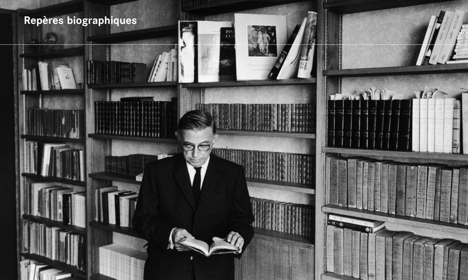
Sartre devant sa bibliothèque

C'est dans les livres que j'ai rencontré l'univers : assimilé, classé, étiqueté, pensé, redoutable encore ; et j'ai confondu le désordre de mes expériences livresques avec le cours hasardeux des événements réels. De là vint cet idéalisme dont j'ai mis trente ans à me défaire.