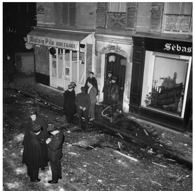
Une charge de plastic explose au 42, rue Bonaparte, le 7 janvier 1962.

Sartre adopte Arlette Elkaim. Situations VII, Les Troyennes . Il se rend en URSS et en Finlande pour participer au Congrès mondial de la paix.