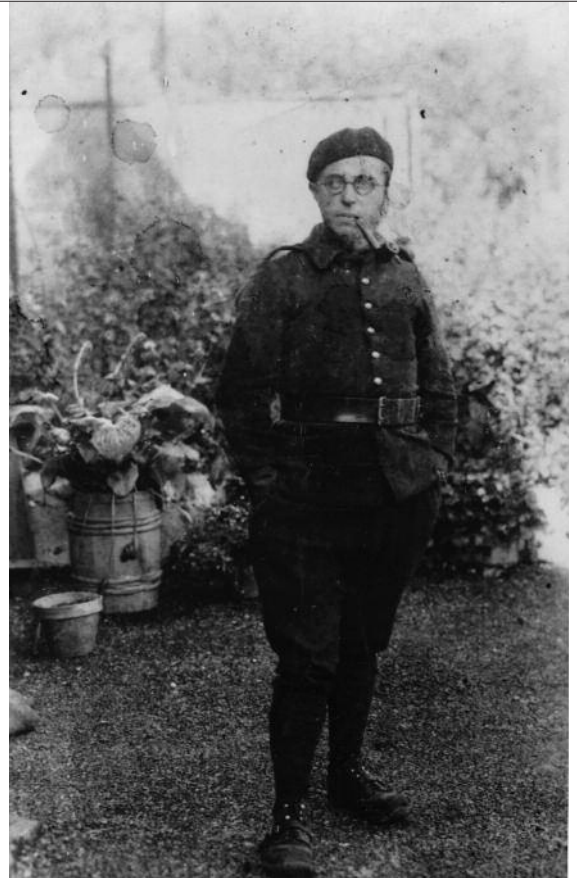
Jean-Paul Sartre, mobilisé en 1939.

Sartre, Les Temps modernes , n° 82, repris dans Situations IV