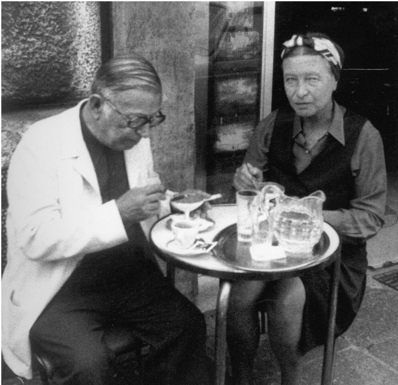
Jean-Paul Sartre et Simone de Beauvoir à la terrasse d'un café

Il prend la direction de La Cause du peuple puis d'autres journaux de tendance maoïste.