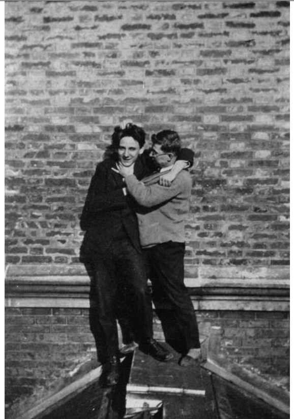
J.-P. Sartre et un camarade sur le toit de l'École normale supérieure.