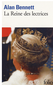
Bennett, Alan La Reine des lectrices

Chaque fois qu'il la rencontre, il est exaspéré par sa voisine de cimetière et son petit carnet de poésie. Un jour pourtant, un sourire éclate simultanément sur leurs lèvres et ils en restent tous deux éblouis... C'est le début d'une passion dévorante. C'est avec un romantisme ébouriffant et un humour décapant que ce roman pose la très sérieuse question du choc des cultures.