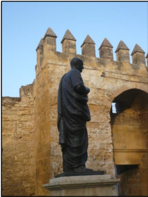
Statue de Sénèque à l'entrée des murailles de Cordoue

DATE ET LIEU DE MORT: 65 après JC, à Rome.