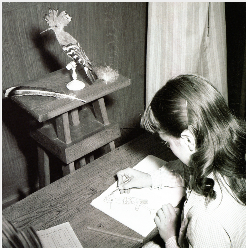
Dessin dit « d'imitation », lycée de jeunes filles, Saint Germain en Laye, 1955 : poursuite d'une tradition de l'éducation aux arts libéraux de l'Ancien régime.