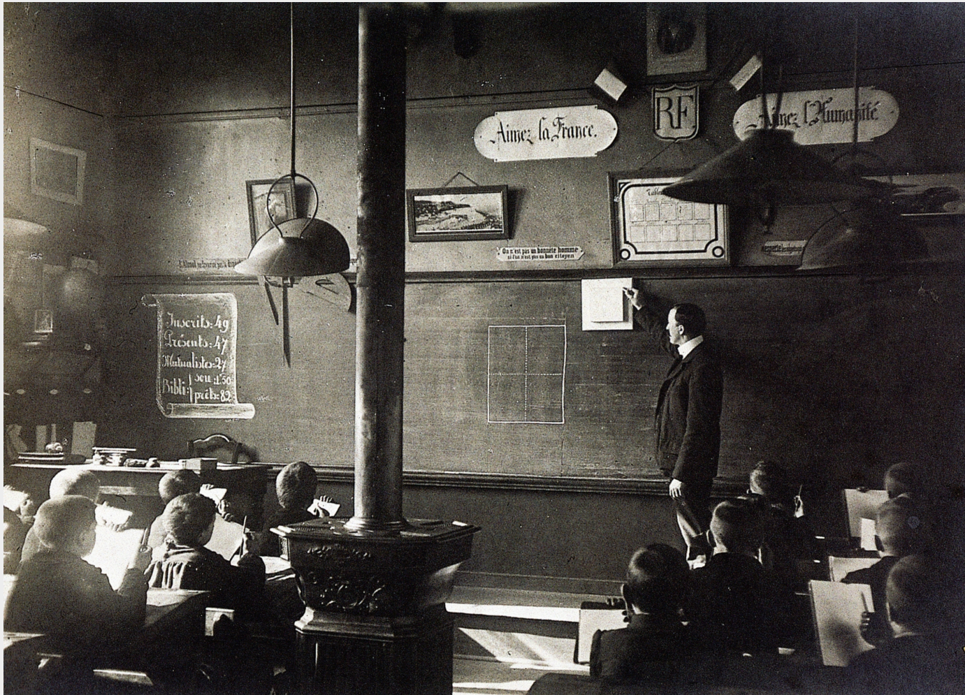
Dessin dit « géométral », école primaire Cabanis, Lille, 1900 : limitation à des savoirs et des techniques utiles dans les besoins des métiers accessibles, pendant et après l'enseignement primaire.