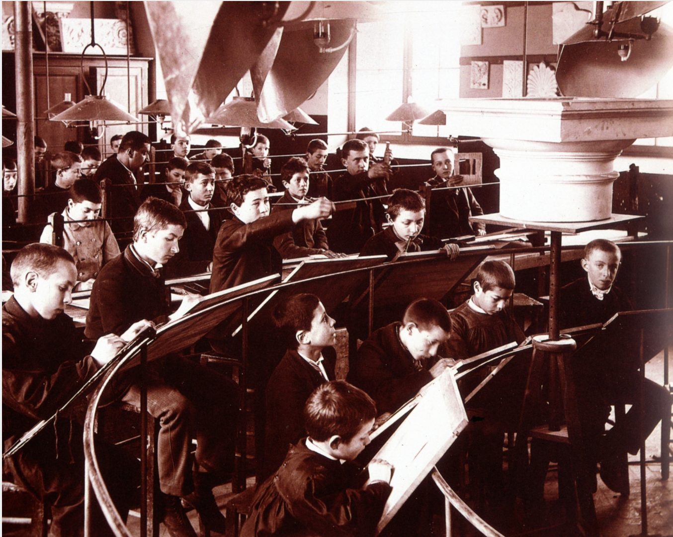
Dessin à vue, primaire supérieur, Sens, 1899 : convocation et permanence d'un modèle de formation académique des spécialistes (les artistes) au-delà de l'enseignement primaire.