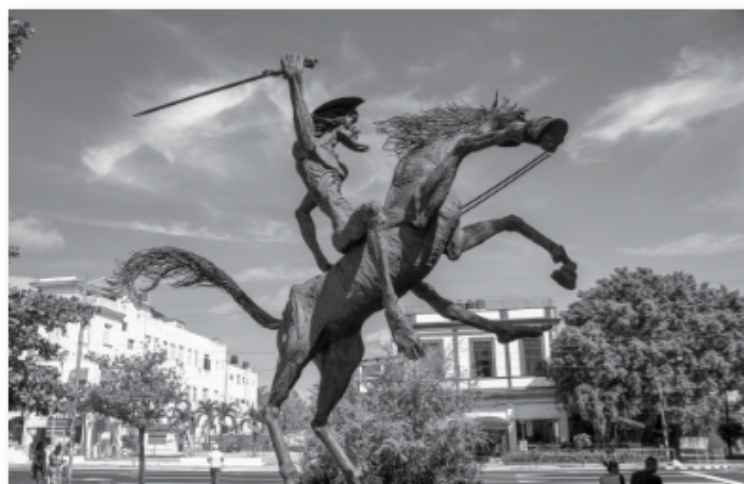
↑ Estatua de Don Quijote en La Habana, Cuba.