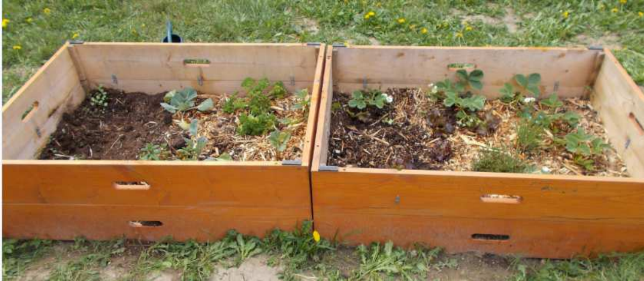
Dans le patio du collège, le jardin pédagogique