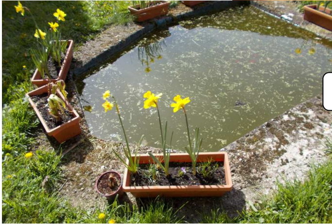
Autour de la mare pédagogique