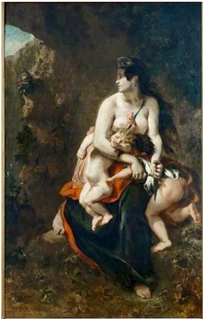
Delacroix, Médée , 1836, 1838

Rappel : Médée est une femme qui a tué ses enfants pour se venger de l'infidélité de Jason, son mari (mythologie grecque).