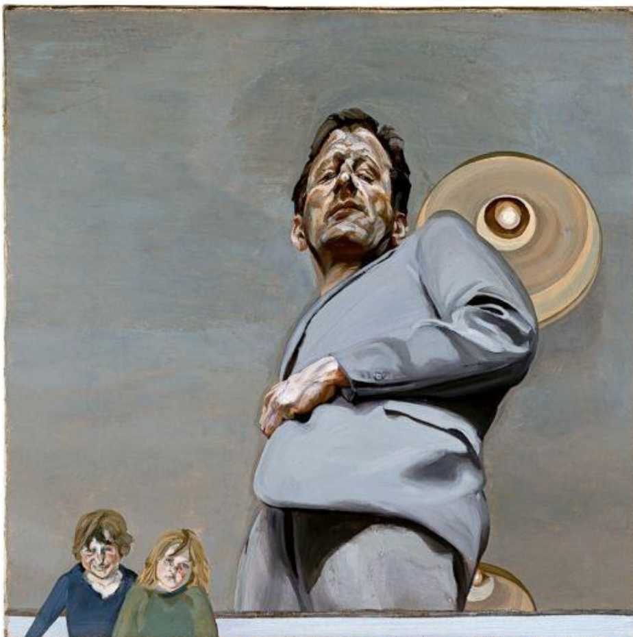
Lucian FREUD, Reflection with Two Children (Self- Portrait), 1965 - Reflet avec deux enfants (autoportrait), 1965

b. Laquelle de ces images choisirais-tu, toi, de placer en couverture d' Un secret de façon à rendre compte de l'enjeu principal du livre à tes yeux ? Justifie.