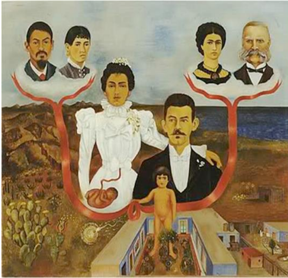
Frida Khalo, Mes grands- parents, mes parents et moi , 1936,