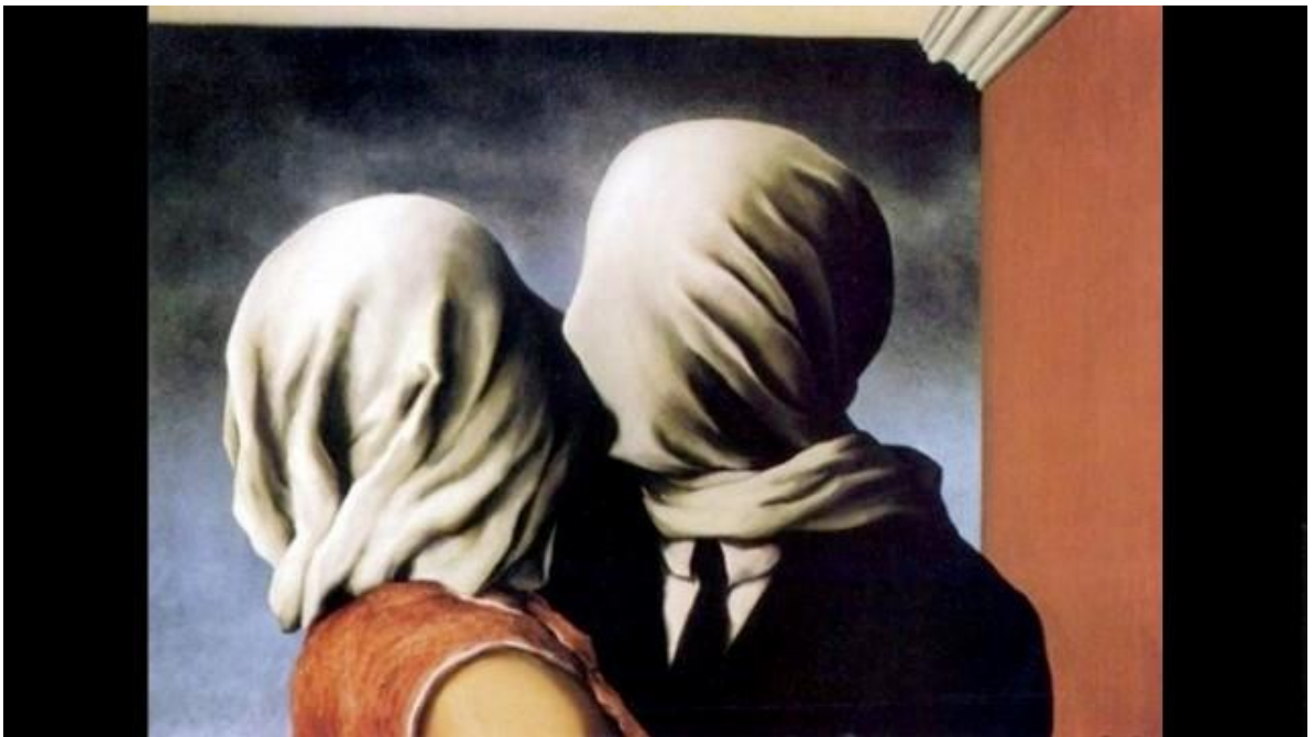
Magritte, Les amants , 1928