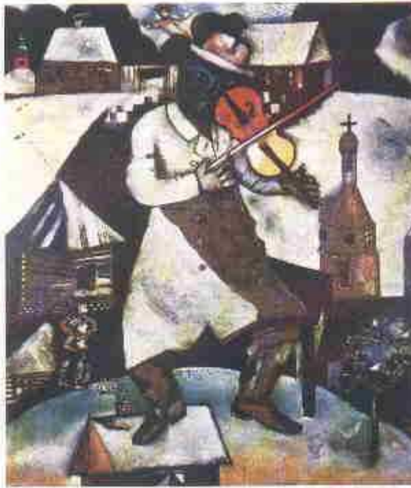
Marc Chagall, Le Musicien, 1912-1913, Encadrure, Bois, huile, gouache