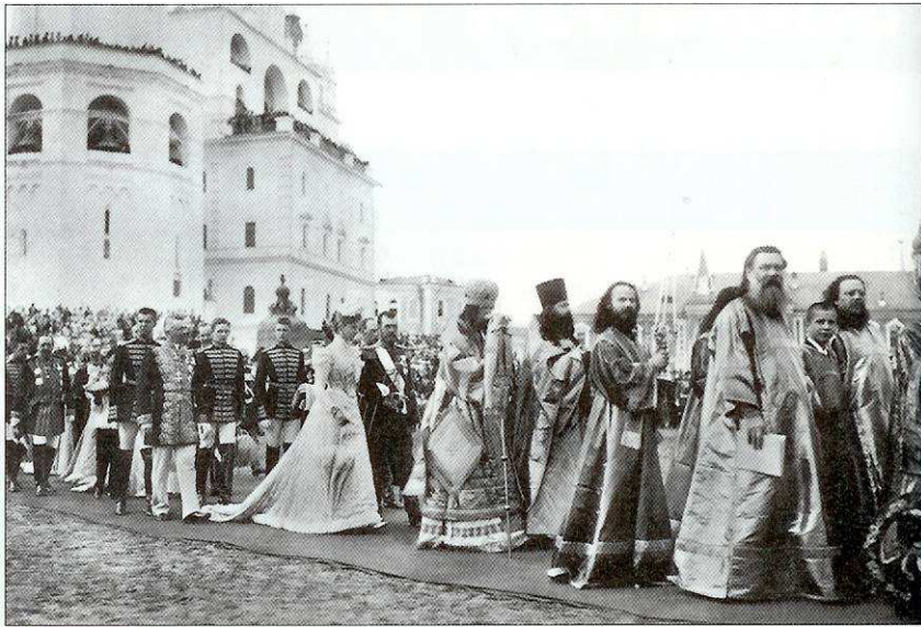
Doc 2. Les soutiens du pouvoir impérial

1) Souverain de droit divin, le tsar dispose d'un pouvoir absolu auquel rien ne s'oppose.