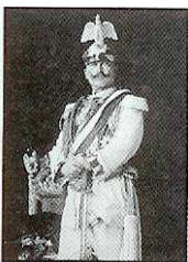
Guillaume II 1888-1918

1) Le pouvoir exécutif est confié à l'empereur ( Kaiser ) qui choisit le chancelier. (1 er ministre).