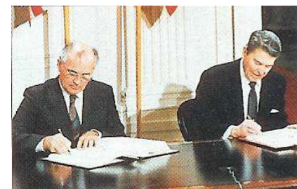
Mikhaïl Gorbatchev et Ronald Reagan

* Les nouvelles menaces : montée du terrorisme lié aux nationalismes et aux intégrismes religieux et politiques.