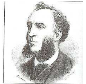
Jules Ferry (1832-1893)