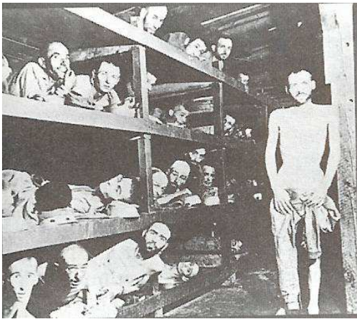
pacte de non-agression en 1939.

- 1917 : installation en Russie d'un régime communiste