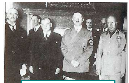
Arthur Neville Chamberlain, Edouard Daladier, Adolf Hitler et Benito Mussolini