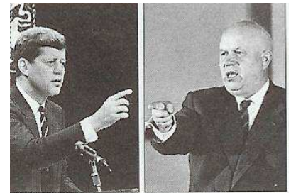
John Fitzgerald Kennedy et Nikita Khroutchev

- Le monde a frôlé deux fois la 3 ème guerre mondiale (en 1951 en Corée et en 1962 à Cuba).