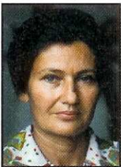
Simone Veil née en 1927

Juriste, femme politique, ministre de la Santé, sous la présidence de V.Giscard d'Estaing, elle défend et fait voter la loi sur l'IVG en 1974.