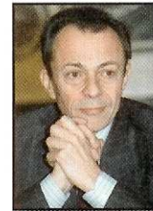
Michel Rocard né en 1930

Avocat, homme politique, ministre de la Justice du premier gouvernement socialiste, son nom est lié à l'abolition de la peine de mort, qu'il fait voter en 1981.