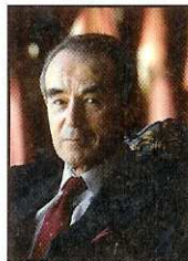
Robert Badinter né en 1928

Juriste, femme politique, ministre de la Santé, sous la présidence de V.Giscard d'Estaing, elle défend et fait voter la loi sur l'IVG en 1974.