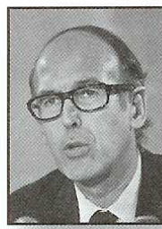
Valéry GISCARD D'ESTAING Né en 1926

Chef de la Résistance pendant la Seconde Guerre mondiale, il est le fondateur de la Ve République. Président de 1958 à 1965, puis de 1965 à sa démission en 1969, il mène une politique d'indépendance nationale.