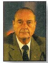
Jacques CHIRAC Né en 1932

Chef du Parti socialiste, son élection en 1981 et sa réélection en 1988 marquent l'alternance politique. Il cohabite deux fois avec un Premier ministre de droite, il convertit la gauche à l'économie de marché, à l'Europe.