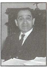
Pierre MENDÈS FRANCE 1907-1982

Président du Conseil en 1954, il donne un nouveau ton à la politique, met fin à la guerre d'Indochine, accorde l'autonomie à la Tunisie. Il s'oppose au général de Gaulle en 1958.