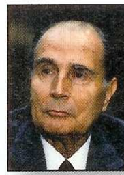
François MITTERRAND 1916-1996

Il place son septennat (1974-1981) sous le signe de la modernisation de la société. Il dirige la Convention qui a préparé la Constitution européenne.