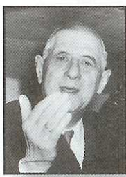
Charles de GAULLE 1890-1970

Président du Conseil en 1954, il donne un nouveau ton à la politique, met fin à la guerre d'Indochine, accorde l'autonomie à la Tunisie. Il s'oppose au général de Gaulle en 1958.