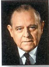
Raymond Barre Né en 1924

Premier ministre de droite modérée (1976-1981) sous la présidence de Valérie Giscard d'Estaing, au début de la crise économique, il veut assainir l'économie française.