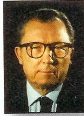
Jacques Delors Né en 1925

Premier ministre de droite modérée (1976-1981) sous la présidence de Valérie Giscard d'Estaing, au début de la crise économique, il veut assainir l'économie française.