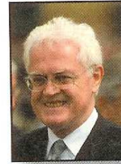
Lionel Jospin Né en 1937

Président de la Commission européenne de 1985 à 1994, il relance la construction européenne, travaille à l'élaboration du traité de Maastricht et de l'euro.