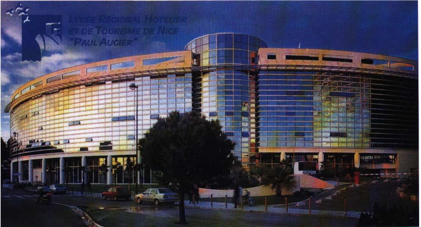
Doc.1 Le lycée hôtelier Paul Augier à Nice