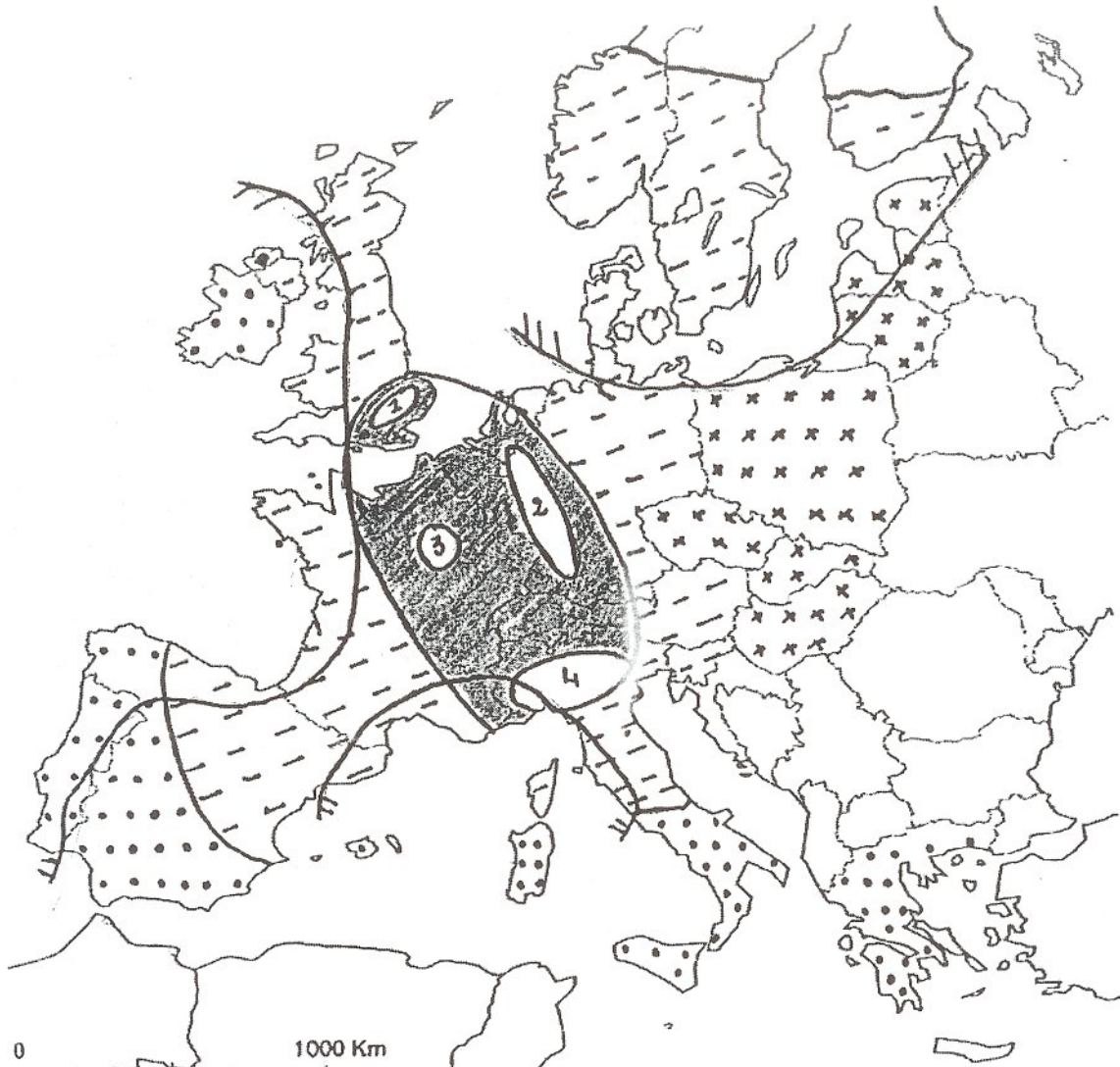
D'après éditions Nathan terminales LES (2004) et Intercartes géographie 1 ère