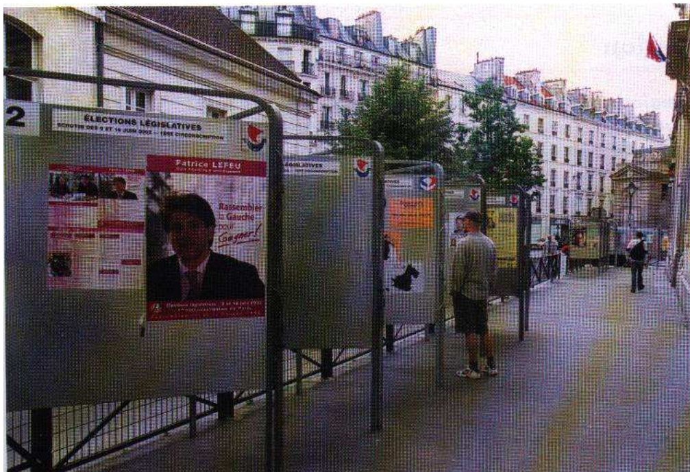
Doc.3 Affiche électorale (élections législatives de 2002)