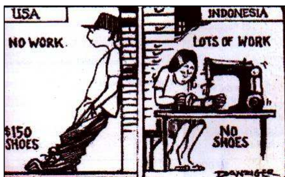
Doc.5 Les chaussures de sport Nike

Doc.5 11) No work : pas de travail $150 shoes : chaussures à 150 $ lots of work : beaucoup de travail no shoes : pas de chaussures.