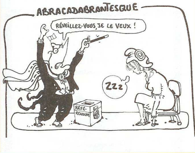
Extrait du dessin de Plantu, L'Express, 5 octobre 2000.

7 ■ De quel genre de dessin s'agit-il ? _____