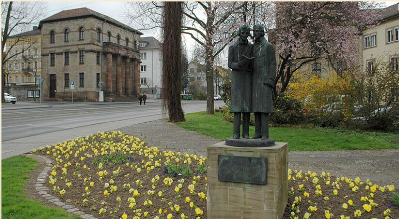
Denkmal der Gebrüder Grimm