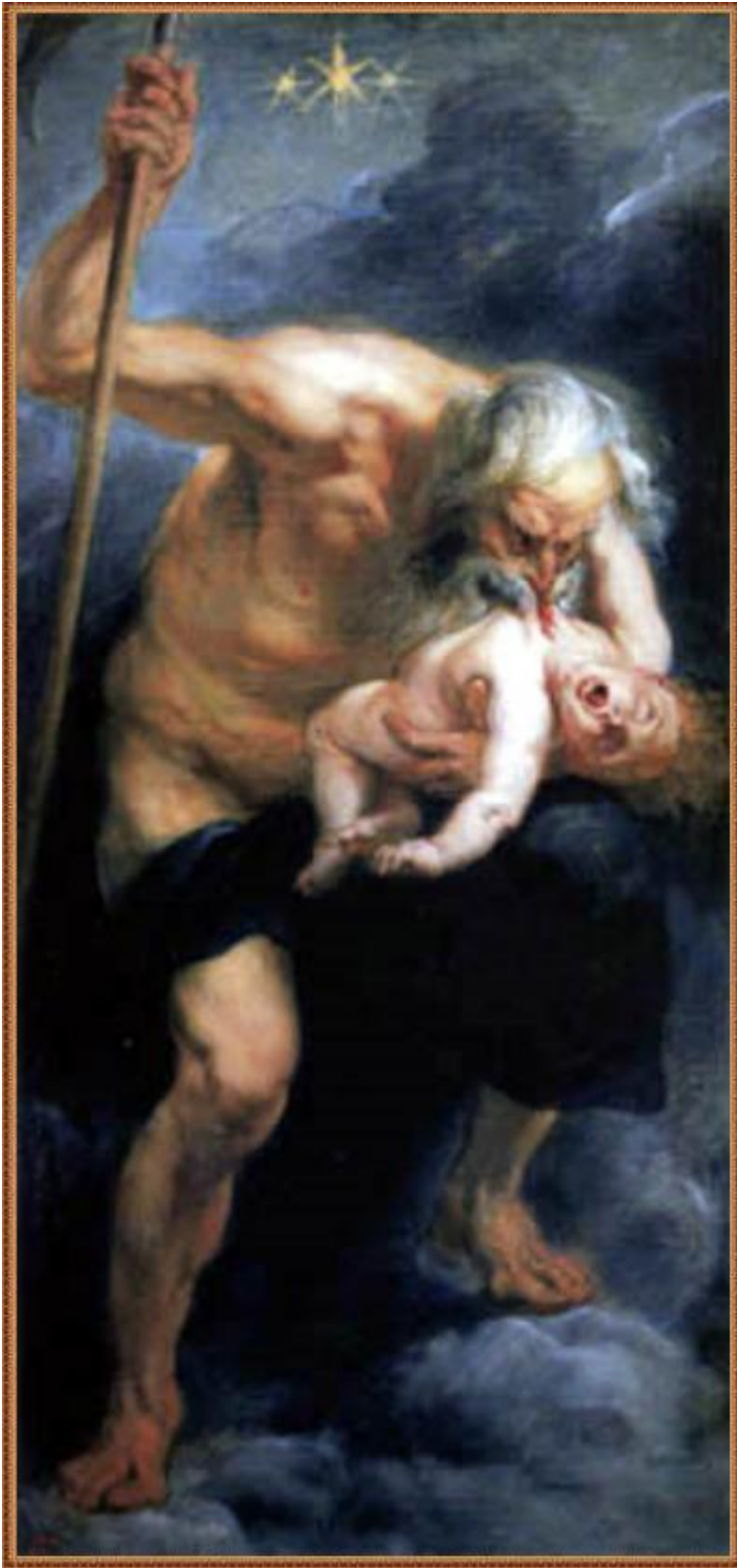
Peter Paul Rubens. Saturne. 1636.