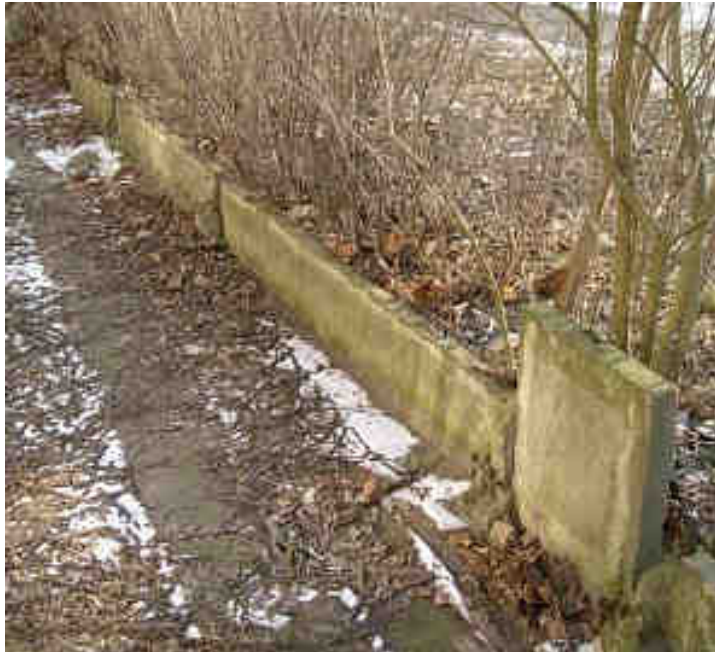
Doc 9. : Des traces du mur

La construction de l'Union européenne va prendre un nouvel élan. Cette liberté naissante dans de nombreux pays va permettre à l'Union européenne d'accueillir de nouveaux pays. (Pologne, Hongrie...)