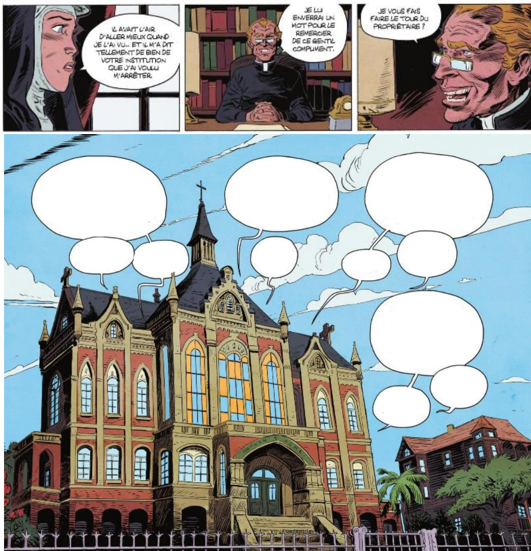
Extrait de La venin , Tome 2, Laurent Astier