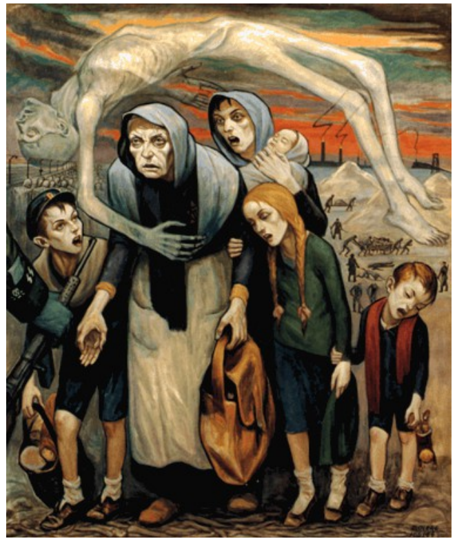
Inaptes au travail - sans date