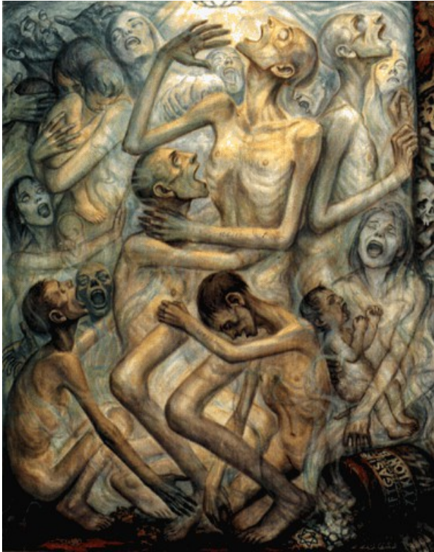
Gazage - sans date, après 1945

Dans un second temps il a pu réaliser des toiles après la guerre. Elles sont inspirées de ses précédents croquis. Plastiquement elles dénotent une stylisation plus concrète et plus forte. Leur intensité est plus marquée, ne serait-ce que par le travail des couleurs. Ses croquis étaient réalisés en noir et blanc ; ses toiles en couleur évoquent des sentiments plus intenses et dégagent un atmosphère plus glauque. Il s'approprie ses toiles et un style tout en restant proche de son vécu dans le camp. Elles témoignent avec toujours autant d'impact du génocide.