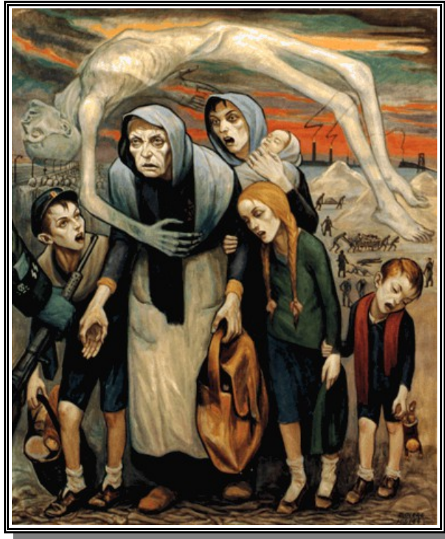
Les Inaptes au travail

Peinture de David Olère, années 1950, 131x162cm, Mémorial de l'héritage juif, New York)