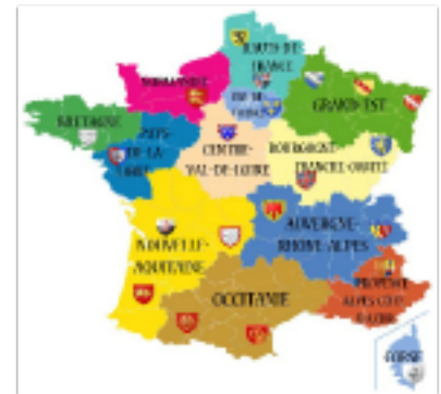
La région est une des collectivités territoriales

Les collectivités territoriales, l'Etat et l'UE décident des choix d'aménagement