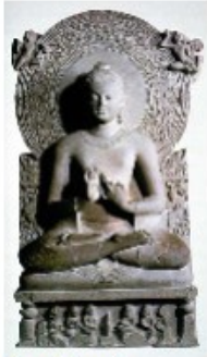
Bouddha de Sarnath (5e siècle ap. JC)

puis diffusion de son message en une nouvelle religion : le bouddhisme 624 av J.C. à 544 av J.C.