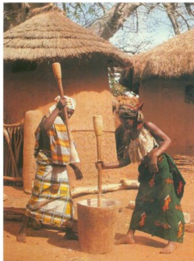
Doc.1 : Des femmes pilant le mil dans un village du Burkina Faso