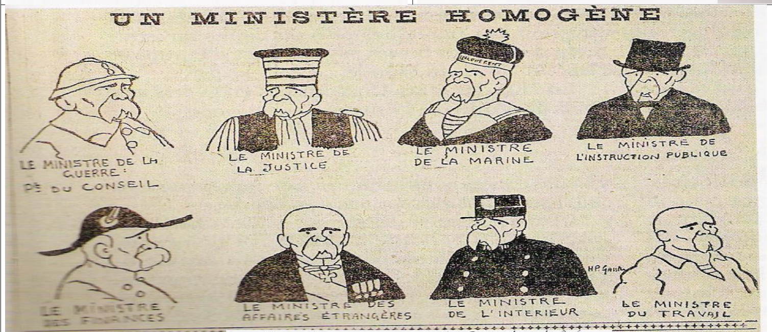
Le cabinet Clémenceau vu par Le Canard enchaîné , 28 novembre 1917.