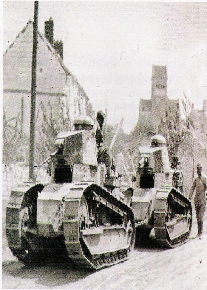
Les chars de la victoire.