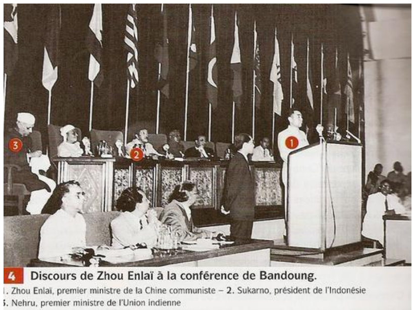
4 Discours de Zhou Enlai à la conférence de Bandoung.

- Après la décolonisation , les pays nouvellement indépendants rencontrent des défis politiques (tensions, dictatures...) et économiques (pauvreté, développement, croissance démographique...).