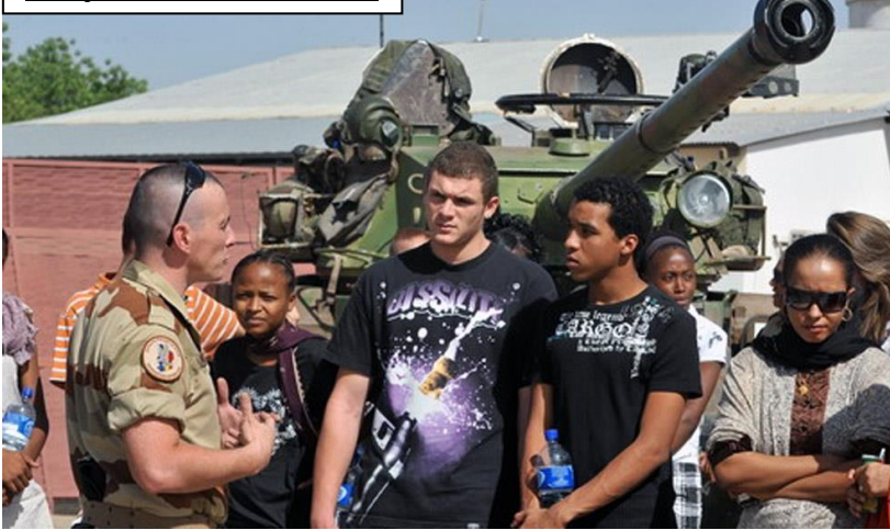
Des jeunes lors de la JDC

→ Les jeunes et l'Armée : quelles sont les nouvelles obligations ?