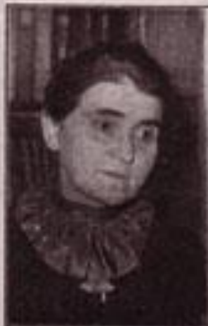
Mlle SUZANNE LACORE, non-écrite d'Etat à la présidence de l'Assemblée.

Il ne semble pas que l'histoire de nos femmes, de Mlle Lacore ou l'histoire de son dévouement, fut en à l'histoire d'appeler dévouement. Elle