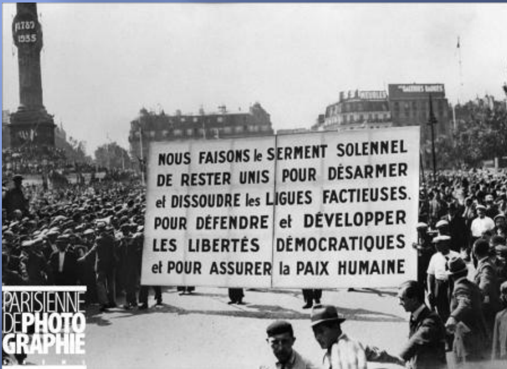
Manifestadeg an tu kleiz d'ar 14 a viz Gouere 1935