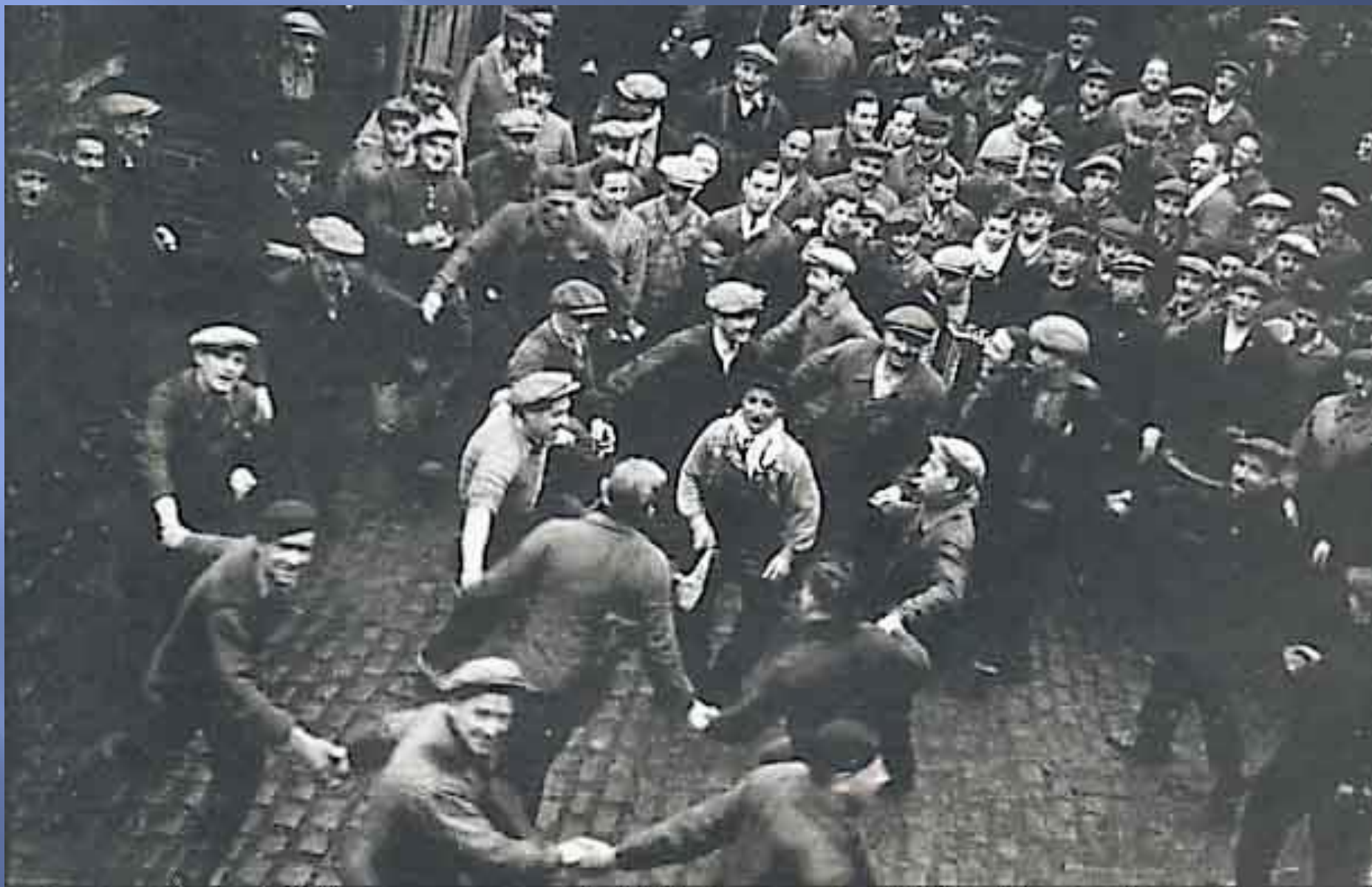
Harzou labour bras ( Miz Even 1936)