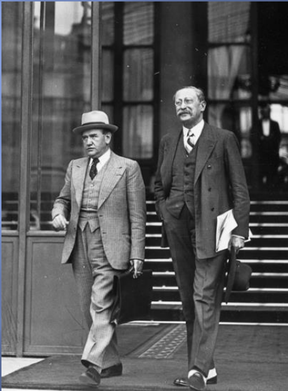
Edouard Daladier a deu da vezañ prezidant ar C'huzul e 1938