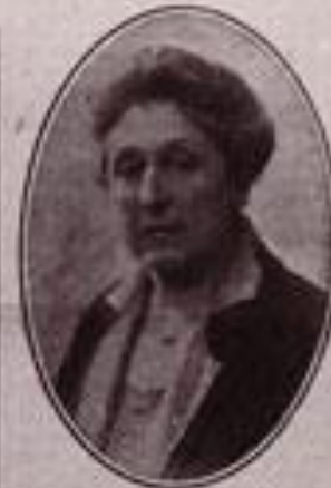
Mme C. BRUNSCHVICH non-écrite d'Etat à l'Assemblée Nationale.