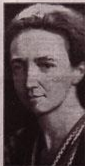
Mme IRÈNE JOLIOT-CURIE non-écrite d'Etat à la présidence de l'Assemblée.