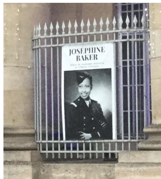
Photo de J.Baker sur les grilles du Panthéon.