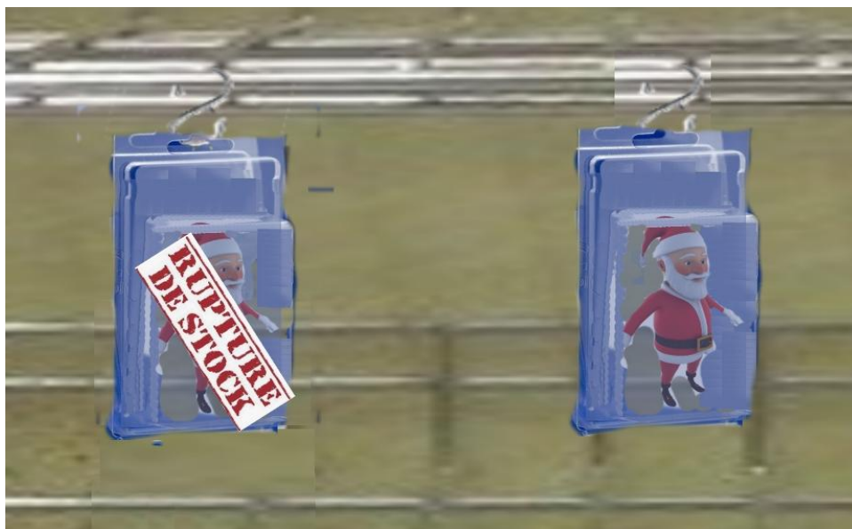
Illustration de Konstantin

T out d'abord, une pénurie est le manque d'une matière. Ces deux dernières années, aucune matière première n'a été épargnée par la pénurie due à la Covid-19. D'ailleurs, l'auteur de L'industrie en cale sèche , Thierry Charles, alertait déjà en 2013 sur une future crise due au manque de ces matières.