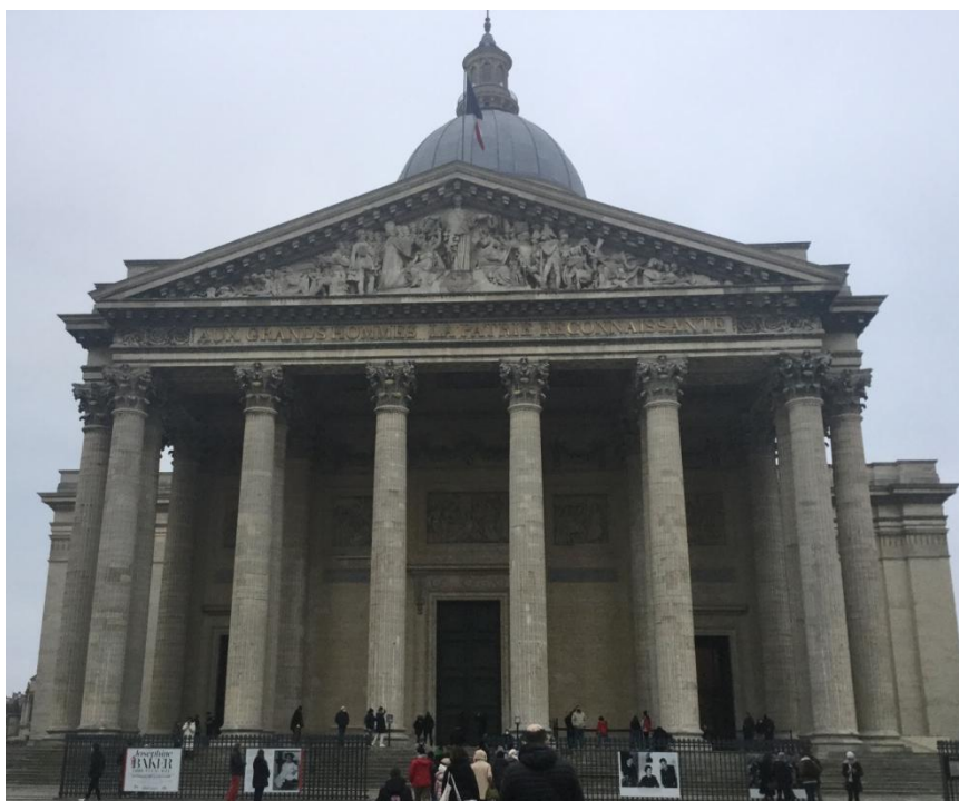
Le Panthéon.