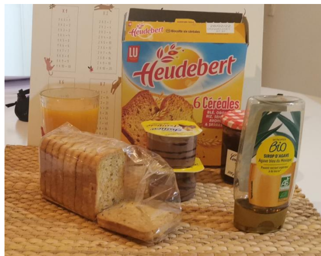
Exemple de petit déjeuner à privilégier.