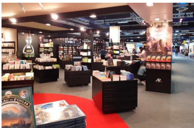
Un stand au Salon du livre.

L e Salon du livre et de la presse jeunesse s'est déroulé du 1 er au 6 décembre 2021 à Montreuil.