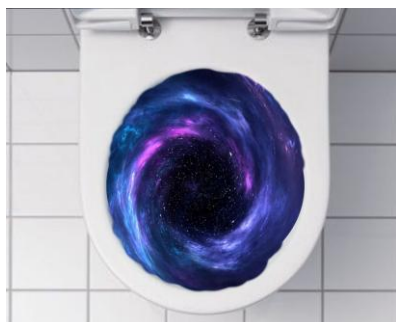
Illustration de Konstantin

En effet, au Moyen-Âge, ils faisaient leurs besoins sur des hippopotames roses volants... si vous m'avez cru, vous êtes vraiment crédules ! En réalité ils jetaient leur déjections par la fenêtre, quel scandale ! C'est pour cela qu'il y avait plein de maladies et que Paris sentait extrêmement mauvais. Les déjections se jetaient dans le cours d'eau le plus proche, comme la Seine ou la Bièvre (voir l'article d'Aurèle sur la Bièvre), qui étaient responsables d'épidémies en tous genres : peste, choléra et j'en passe.