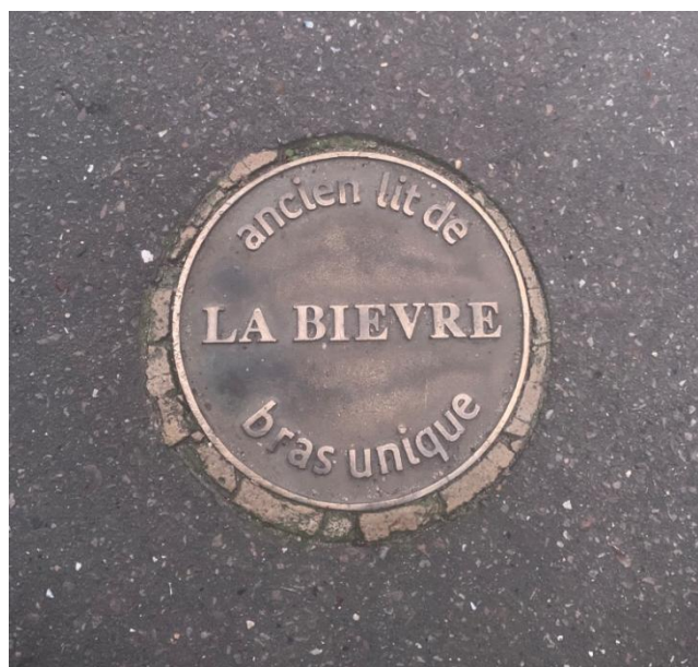
Plaque rue Nicolas Houel.

Les habitants trouvent que c'est une très bonne idée. Je suis d'accord ; faire ressortir un cours d'eau dans un espace urbanisé serait super, cela rajouterait de la fraîcheur en ville, pourrait aussi ouvrir de nouvelles promenades au bord de l'eau, ce qui serait très agréable.