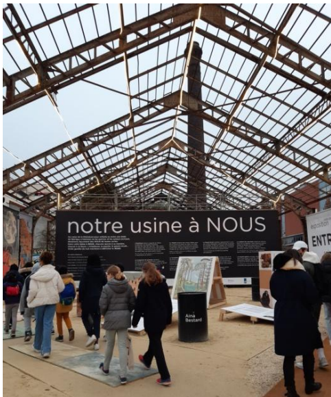
L'expo à l'entrée su Salon.

Cette année, il a rassemblé plus de 1000 artistes, 450 exposants et a accueilli 179000 visiteurs ! Les enfants sont venus par milliers pour se faire dédicacer les livres de leurs auteurs préférés, mais aussi pour découvrir de nouveaux ouvrages. Comme chaque année le salon est présenté autour d'une thématique, cette fois le thème choisi : « Nous ! ». Il y avait donc l'exposition à l'entrée intitulée « Notre Usine à NOUS ! », librement ouverte à tous.