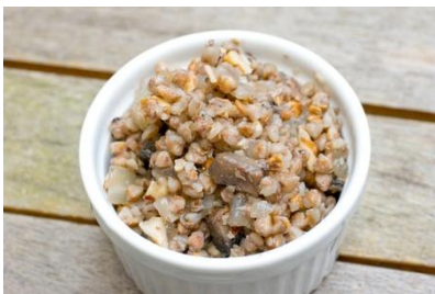
Kasha. Image clipart

🍷 Ensuite, je vous présente la Russie, grand pays frisquet où il faut manger des choses bien chaudes si on ne veut finir bleu comme un schtroumpf ! Le matin on mange du kasha, une sorte de bouillie faite à base de flocons d'avoine, de sarrasin, de blé ou de millet. Elle est parfois accompagnée d'œufs (omelette, à la coque, ou brouillé) ou d'un sandwich.