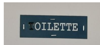
Au 3ème étage du collège.

✚ Info exclusive : au 3 ème étage du collège il y a des oilettes et non pas des toilettes, même si je pense que c'est plutôt un élève avec un feutre qui a effacé le T!