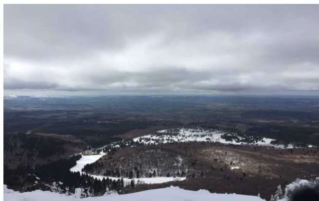
Le paysage auvergnat depuis le haut de l'ancien volcan

Le voyage s'est poursuivi le lendemain avec une visite de l'usine Michelin à Clermont-Ferrand, principal employeur de la ville et pas des moindres. Michelin est une entreprise renommée et connue dans le monde entier. Nous avons ainsi pu découvrir la folle épopée de cette entreprise qui ne fabrique pas que des pneus. En effet, son activité s'est étendue et s'étend encore aujourd'hui dans de nombreux domaines : pneumatique, habillement, industrie de guerre, cartographie, etc. Avant le retour au lycée, un dernier petit détour pour découvrir un autre ancien volcan, celui du Gour du Tazenat, maintenant devenu un lac. Un maar dans le vocabulaire scientifique.