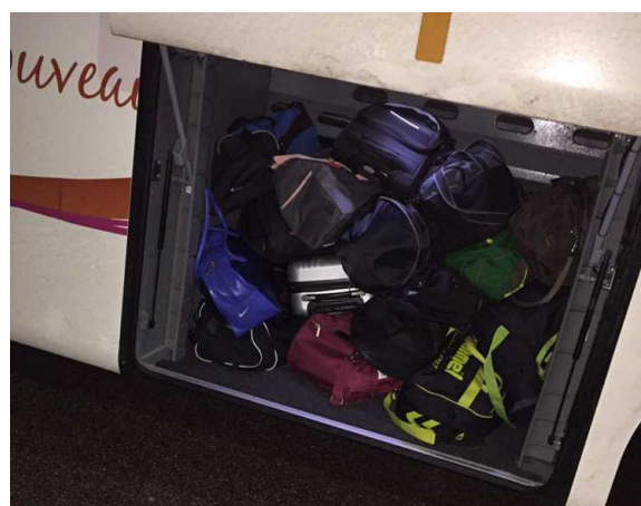
La soute à bagages, bien agencée par les élèves