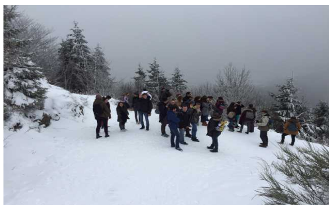
Les élèves lors de l'ascension du Puy de Dome

Le voyage organisé sur deux jours par J. LASNIER et D. ROUSSEAU, et accompagné de M. CETRE, a permis aux élèves de Première d'en apprendre plus sur le monde qui les entoure. La première journée a été consacrée à la visite du Puy de Dôme, un ancien volcan endormi. L'ascension de cet ancien volcan mais aussi la descente n'ont pas été de tout repos ! En effet, la neige était présente. La journée s'est poursuivie avec un pique-nique au sommet et une visite l'après-midi du volcan de Lemptégy. Avec des enseignants de SVT et de Physique-Chimie mais aussi de vidéos, d'un musée et d'une guide, les élèves ont pu découvrir les secrets de la volcanologie dans cette région autrefois très instable du fait des nombreuses éruptions volcaniques.