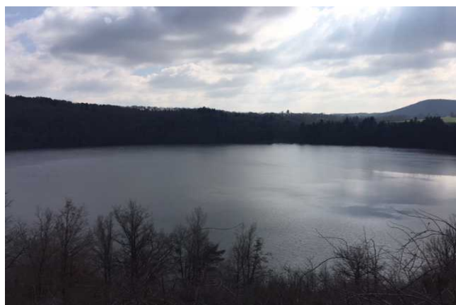
Le Gour de Tazenat

Le voyage s'est poursuivi le lendemain avec une visite de l'usine Michelin à Clermont-Ferrand, principal employeur de la ville et pas des moindres. Michelin est une entreprise renommée et connue dans le monde entier. Nous avons ainsi pu découvrir la folle épopée de cette entreprise qui ne fabrique pas que des pneus. En effet, son activité s'est étendue et s'étend encore aujourd'hui dans de nombreux domaines : pneumatique, habillement, industrie de guerre, cartographie, etc. Avant le retour au lycée, un dernier petit détour pour découvrir un autre ancien volcan, celui du Gour du Tazenat, maintenant devenu un lac. Un maar dans le vocabulaire scientifique.