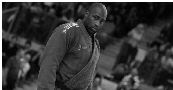
Teddy Riner