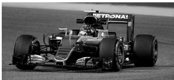
Nico Rosberg au volant de sa Mercedes

Nico Rosberg, vient de remporter le Grand Prix du Bahreïn, ce dimanche 3 avril, après un départ parfait et une domination sans réelle contestation possible (Lewis Hamilton l'ayant ennuyé seulement deux tours). C'est sa deuxième victoire en autant de Grand Prix, après celui d'Australie. Il conforte donc sa première place au classement général, avec 50 points, et Lewis Hamilton est second avec 33 points. La dernière place du podium est détenue par l'Australien Daniel Ricciardo (24 points). A noter que Sebastian Vettel a dû déclarer forfait, en raison d'une casse moteur dans le tour de formation, et occupe la 6ème place avec seulement 15 points. Le Français Romain Grosjean est 5ème avec 18 points, et suite à son accident au Grand Prix d'Australie, qui a réduit sa McLaren en tas de ferraille, Fernando Alonso a été laissé au repos.