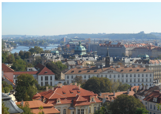
La ville de Prague