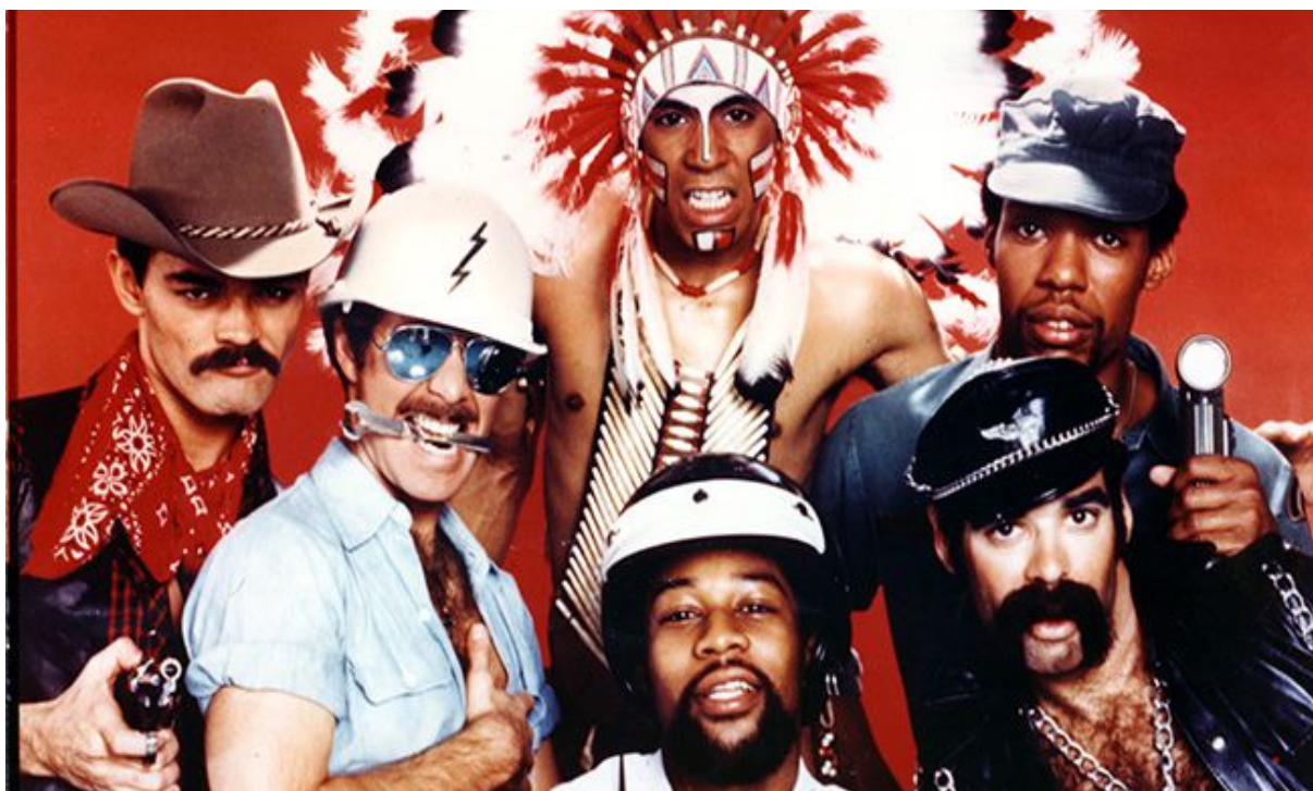
Le groupe en 1977

(Re)Découvrez sans plus tarder les classiques de ce groupe mythique sur Youtube et autres plateformes d'écoute !