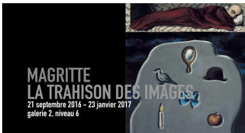
Affiche du centre Pompidou

« L'exposition Magritte. La trahison des images propose une approche à ce jour inédite de l'œuvre de l'artiste surréaliste belge René Magritte. Rassemblant les œuvres emblématiques, comme d'autres peu connues de l'artiste, provenant des plus importantes collections publiques et privées, l'exposition offre une lecture renouvelée de l'une des figures magistrales de l'art moderne. »