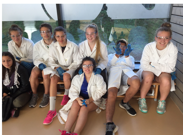
La bonne humeur était aussi au rendez-vous !