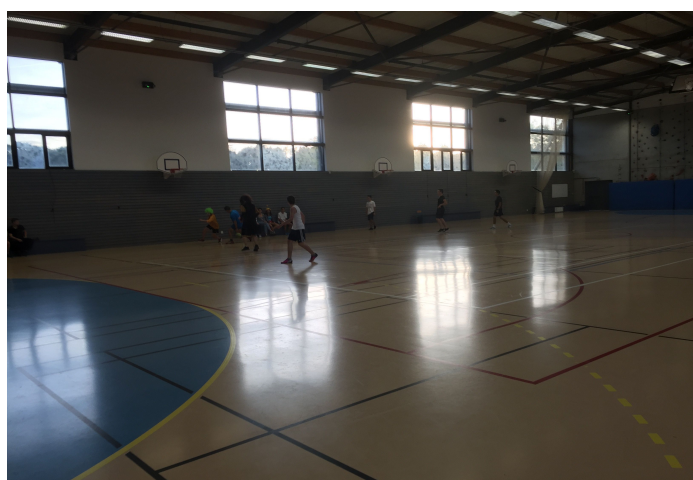
En pleine action