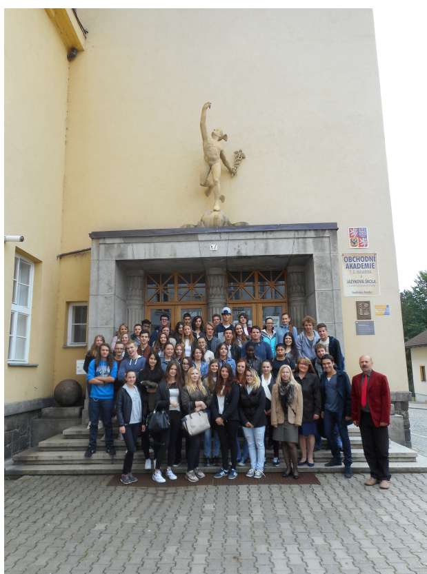
L'ensemble de la troupe !