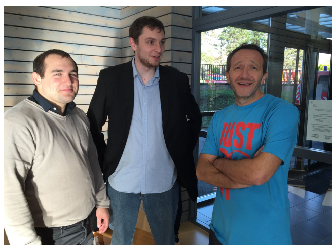
Certains professeurs étaient aussi présents pour jouer et encourager tout le monde.