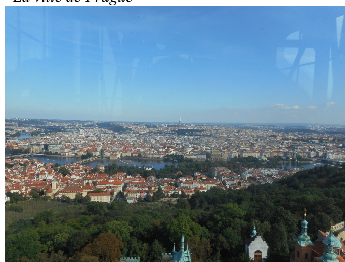
Prague, vue en hauteur.