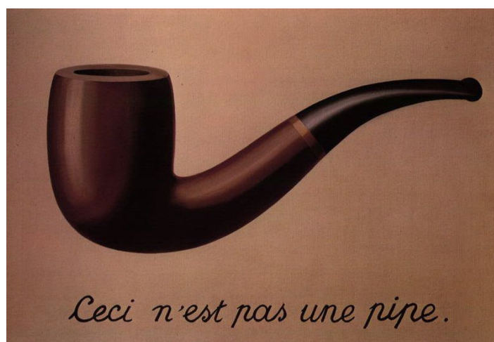
L'une de ses œuvres les plus célèbres : Ceci n'est pas une pipe.