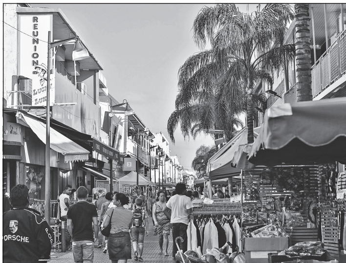
Doc. 4 Une rue commerçante de Saint-Pierre.

6. Décris le paysage de la ville en complétant le tableau.