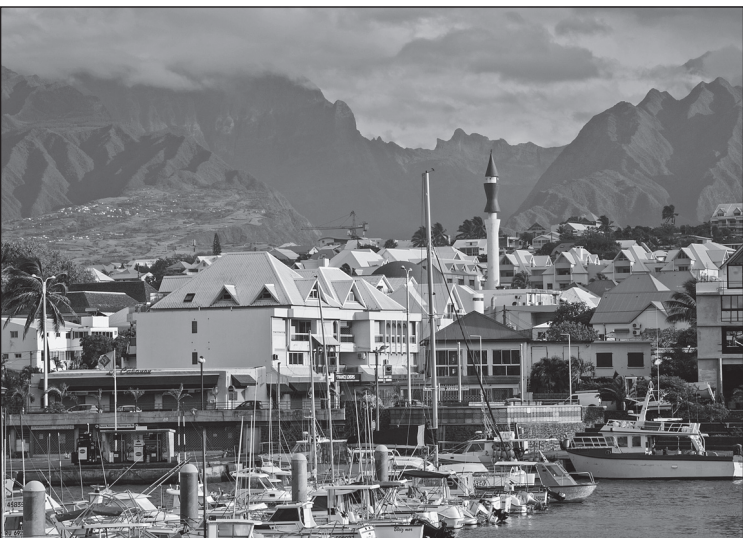
Doc. 3 Le port de Saint-Pierre.