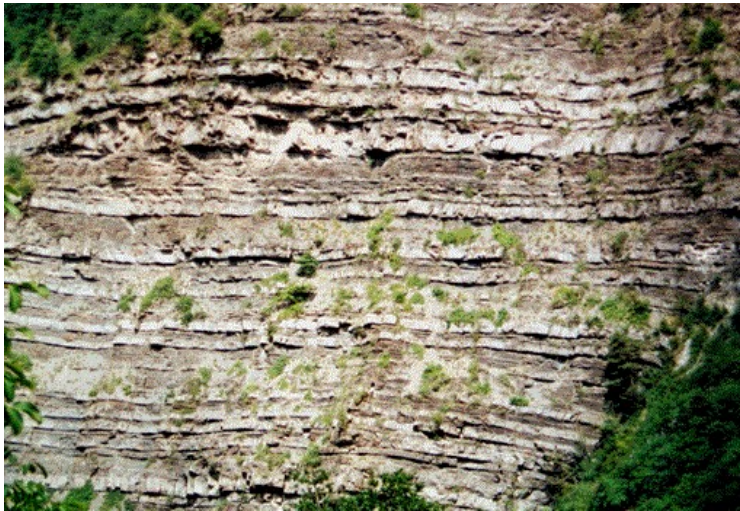
Document 6 : Photo d'un affleurement de roches sédimentaires