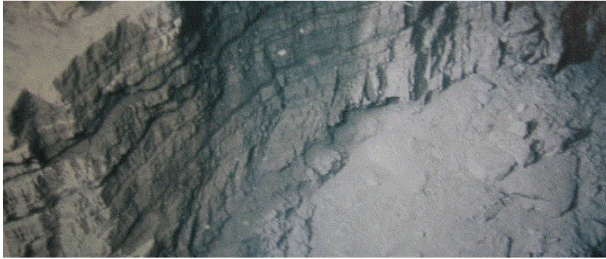
Document 6 : Photo d'un affleurement de roches sédimentaires