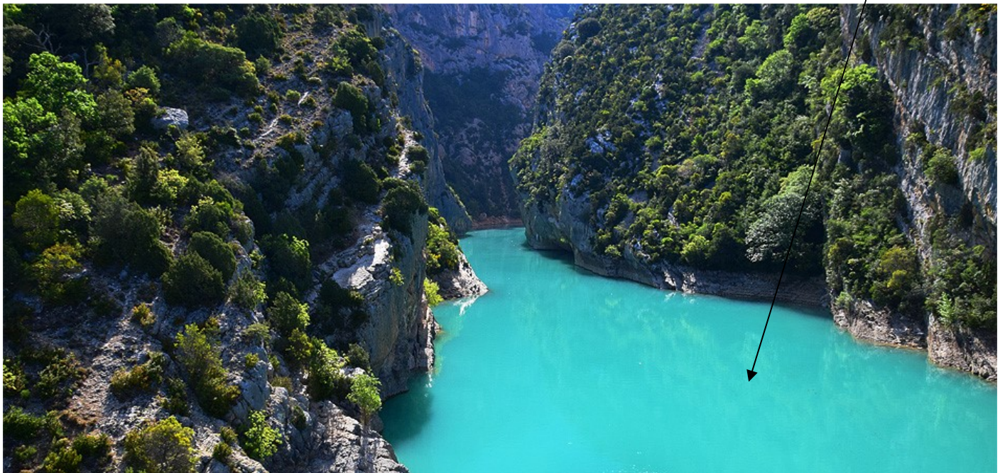
Document 1 : Le grand canyon du Verdon