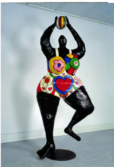
La série des Nanas dont Black Venus, 1965-1966 (279.4 x 88.9 x 60.9 cm, armature métallique et résine de polyester)