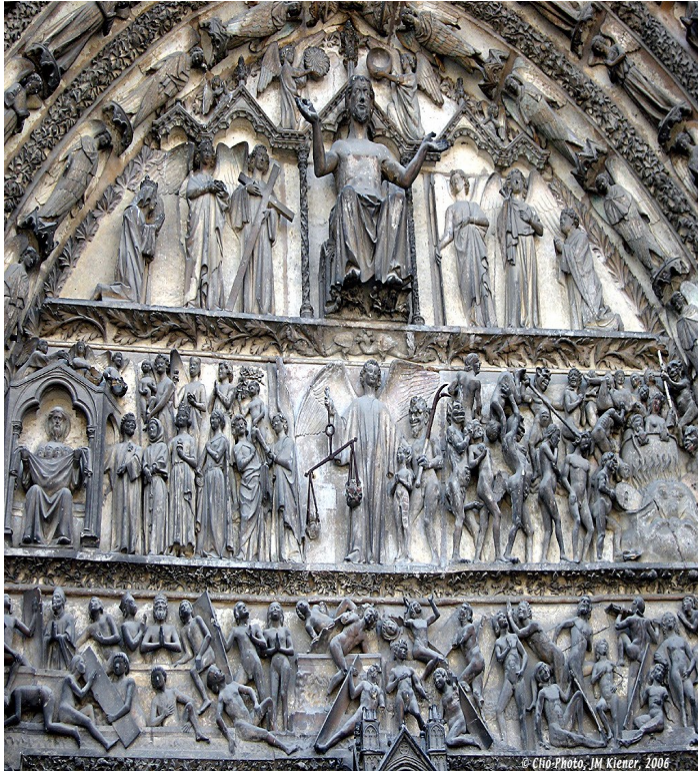
Tympan de la cathédrale de Bourges (1195, début de la construction)