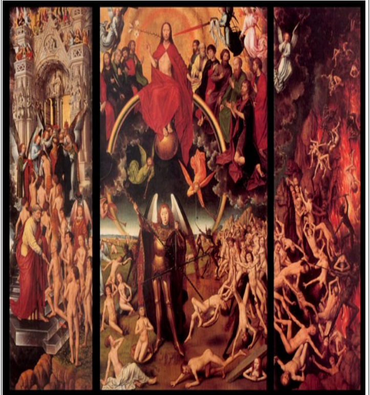
Triptyque du Jugement dernier, Hans Memling, 1467-1471