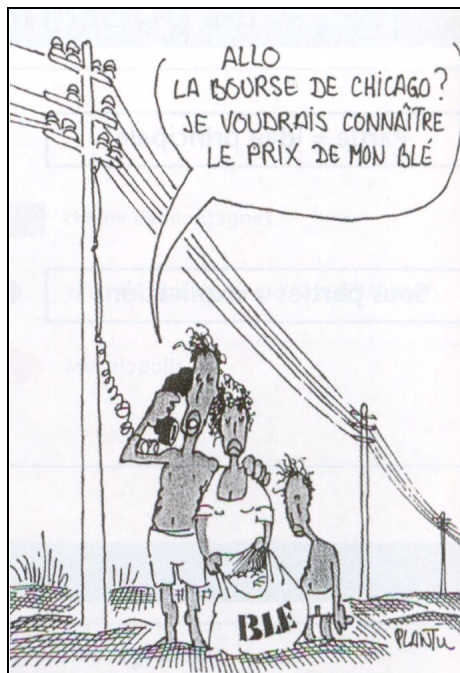
Document 1 : Dessin de Plantu dans Le Monde du 30 septembre 2002