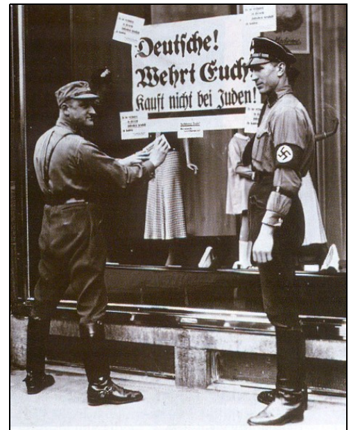
Doc.11 : Un régime antisémite : le boycott des magasins juifs a commencé dès 1933. (« N'achetez pas juif ! »).