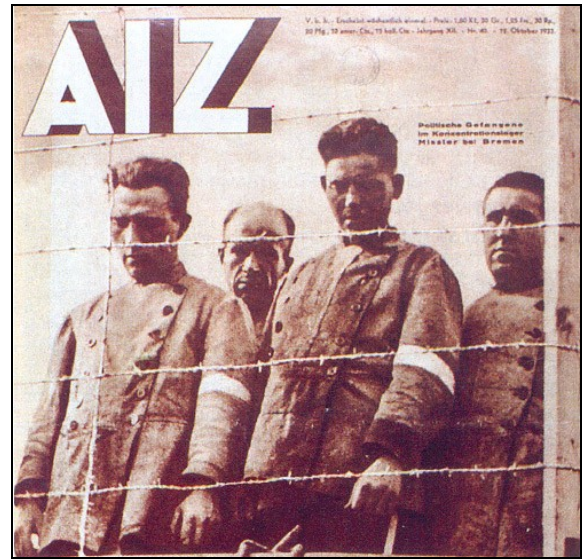
Doc.7 : Les opposants politiques sont enfermés dans le premier camp de concentration à Dachau. Couverture de la revue AIZ. 12 octobre 1933.