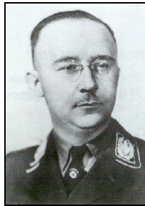
Doc.6 : Heinrich Himmler, chef des SS depuis 1929 et de la Gestapo depuis 1934. La Gestapo, créée en avril 1933, est la police secrète du régime nazi : elle est chargée d'arrêter et de torturer les opposants.

Doc.8 : Le rôle des Jeunesses hitlériennes. A partir de 1926, les jeunes Allemands de 6 à 18 ans doivent participer aux Jeunesses hitlériennes (sport, entraînement paramilitaire, chants, discipline).