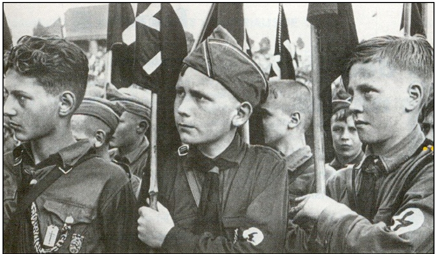
Doc.9 : Un groupe des Jeunesses hitlériennes. Leurs activités sont de nature paramilitaire. S'y inscrire est obligatoire dès 1936

1- Qu'est-ce que les Jeunesses hitlériennes (doc.8 et 9) ? Quel est leur rôle ? Les Jeunesses hitlériennes sont une organisation créée par Hitler et qui encadre les jeunes Allemands afin de former de bons nazis, obéissants et soumis au Führer, et prêts à se battre pour lui.