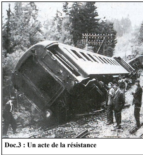
Doc.3 : Un acte de la résistance