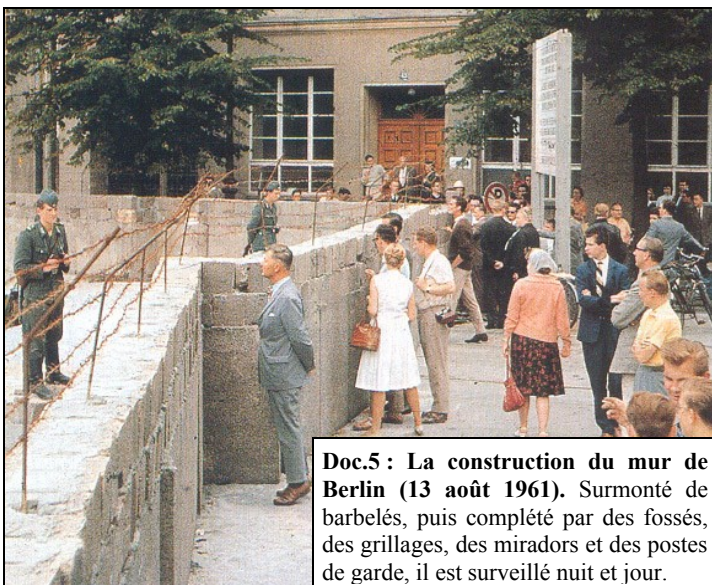
Doc.5 : La construction du mur de Berlin (13 août 1961). Surligné de barbelés, puis complété par des fossés, des grillages, des miradors et des postes de garde, il est surveillé nuit et jour.