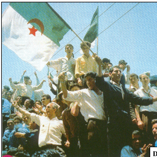
Doc.5 : L'indépendance de l'Algérie, 1962

Doc.6 : La coopération. A partir de 1960, la France mène une politique de coopération avec ses anciennes colonies (aides financières, envoi de coopérants : conseillers techniques, enseignants...).