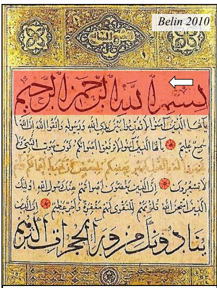
Doc.1 : Page d'un Coran du XII e siècle debut de la sourate sens de lecture rosette qui sépare les versets