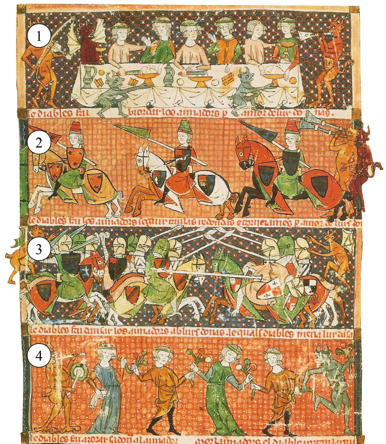
▲ Doc.2 : La vie du chevalier, Magnard 2010