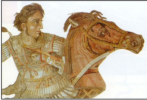
Doc.1 : Alexandre au combat