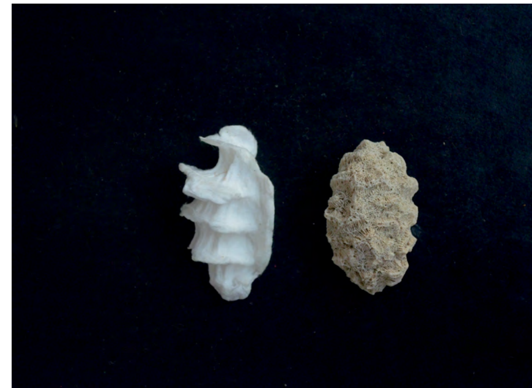
the unity is submarine, installation, empreinte de main en coton, corail, 2014