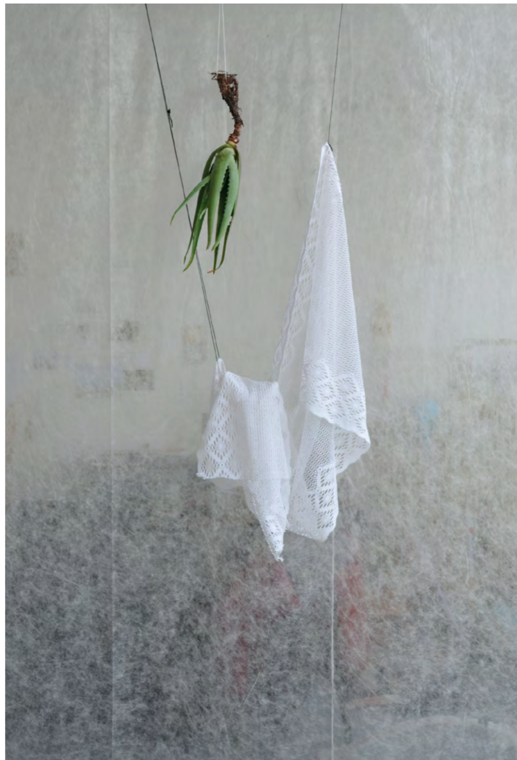
l'hommage, installation, aloes, tissu, 2014

"the unity is submarine" est une citation de Kamau Brathwaite, célèbre poète né à Barbade. Caribéenne, ce titre est pensé par Minia Biabiany comme un point de départ pour connecter la poésie du lieu, ses vestiges du temps, l'imaginaire de la mer et le paradigme de l'archipel.