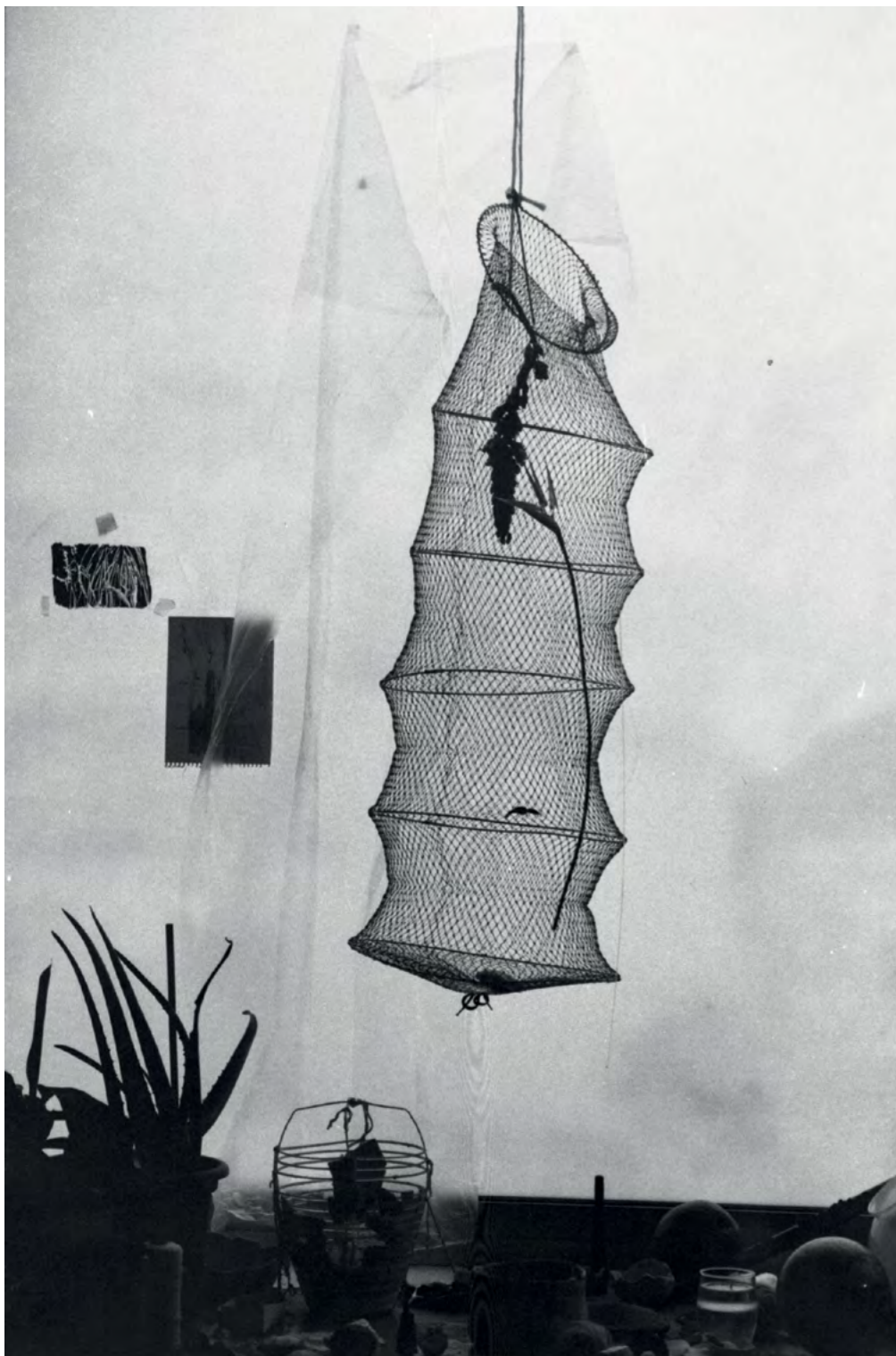
vue du studio, photographie argentique noir et blanc, 2014