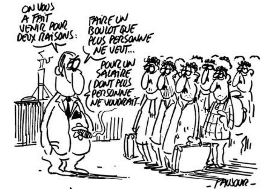
Document n°2 - Caricature