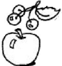
fruits (vignes ou vergers)